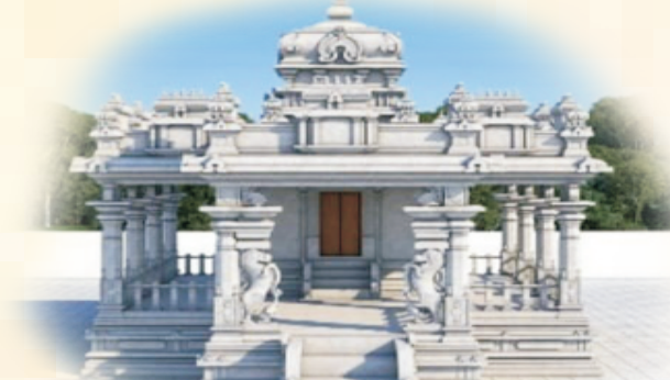
ಶ್ರೀ ಅನ್ನದಾನಿಶ್ವರ ದೇವಮಂದಿರಮಠ, ಮಣಕವಾಡ